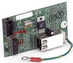
2XX-EIP Ethernet Industrial