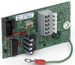
2XX-RS232 Puerto serial bidireccional adicional con handshake