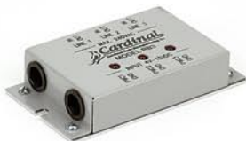
RB3 - caja de relays con 3 relays estado sólido RB9 - caja de relays con 9 relays estado sólido