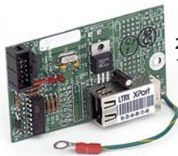
2XX-IP 10/100 MB TCP/IP Ethernet