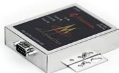
6600-1061 Control® DeviceMaster RTS 1 puerto serial a Ethernet 10/100 MB