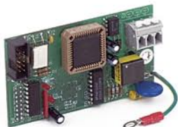
2XX-AB Tarjeta opcional Allen-Bradley®