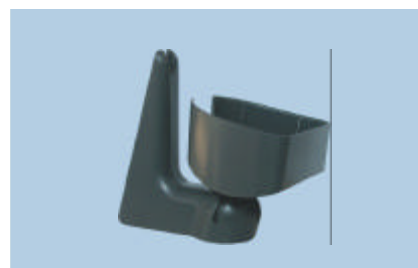
Soporte de pared