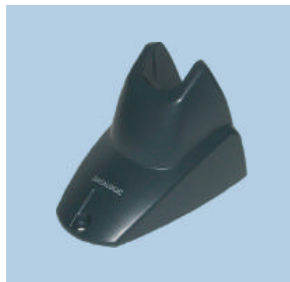
STD Heron™ Soporte manos libres con pletina de metal opcional