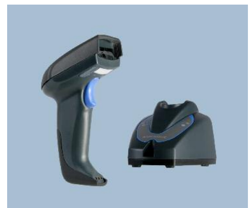
Lector y base QuickScan Mobile